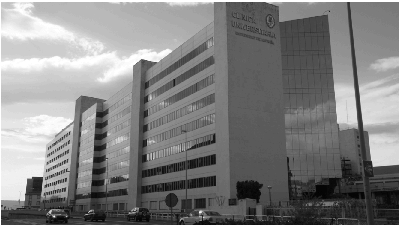
Spain, Avenida de Navarra, Clínica Universitaria de Navarra